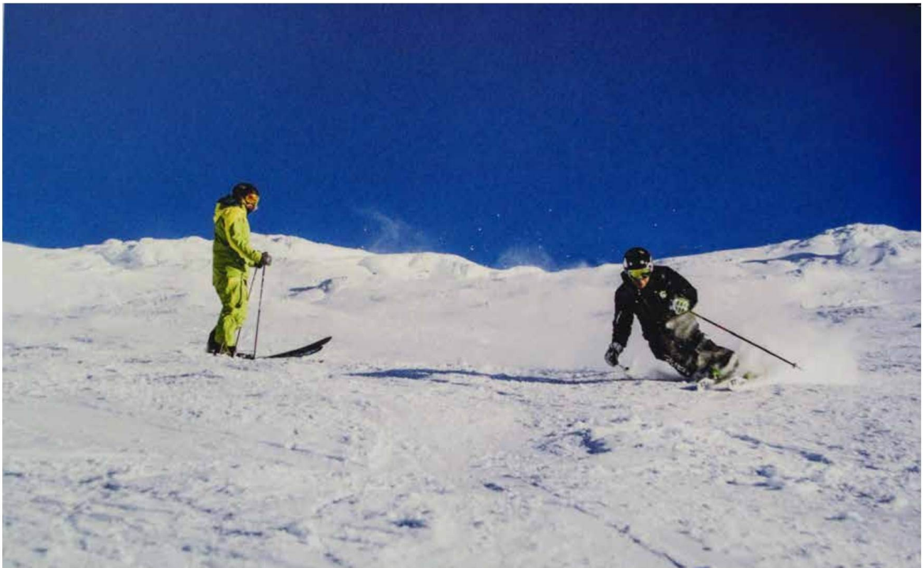
Skidåkning i Åre är en upplevelse i sig och behöver inte vara förknippad med prestation. Foto: Jonas Kullman. Bild ur boken

En del böcker tycks höra nära samman med författarnas egna liv och livsval. Dit hör "Slow Skiing" av Cissi och Mats Erwald.